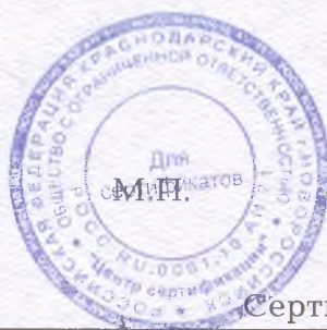
Схема сертификации 4.

НА ОСНОВАНИИ акта оценки оказания услуг № 32192 от 03.03.2017